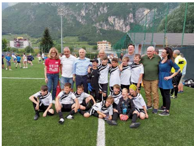
La formazione vincitrice della Coppa Biasior 2022

Il 4-5 giugno 2022 si è disputata la sfida per la 66ª edizione della Coppa Biasior, la manifestazione regionale più longeva di campionato di calcio giovanile. La squadra di Sopramonte è risultata vincitrice, ma anche le altre squadre hanno saputo creare un clima di tifoseria ed entusiasmo tra i numerosi spettatori.