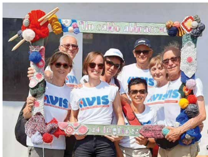
il sentiero più lungo del mondo, un caldo abbraccio

Il 24 luglio si è concluso l'ambizioso progetto di entrare nel Guinness dei primati con il confezionamento della sciarpa più lunga del mondo come "Caldo abbraccio", in quanto costituita da sciarpe lavorate a maglia nel periodo del lockdown da settecento trentanove volontari, per un totale di sei tonnellate di lana per ben ventisette chilometri di lunghezza. Anche AVIS Comunale Trento assieme ad AVIS Valle Dei Laghi, AVIS Cimone-Garniga-Alde- no e ad altre quarantanove associazioni ha contribuito all'iniziativa. Domenica 24 luglio la maxi sciarpa è stata srotolata da Castel Toblino fino alla Chiesetta degli Alpini in località Camp del monte Bondone, documentando così, anche con una ripresa da parte di un drone, la lunghezza raggiunta. Lì sono stati idealmente tirati anche i Fil Rouge delle tre AVIS per congiungersi al punto di arrivo. La sciarpa verrà poi divisa in pezzi per confezionare duemilacinquecento coperte da donare ad associazioni di volontariato.